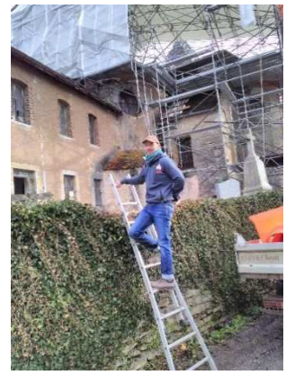
Eglise de Cirey : bientôt la fin des travaux !