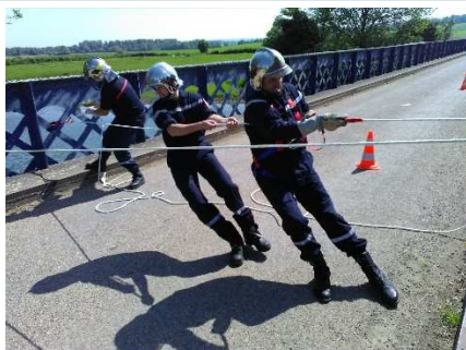
Le CPI se relance ...